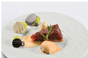
長野県産りんごのタルトタタン