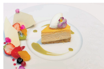
フロマージュ・キュイ